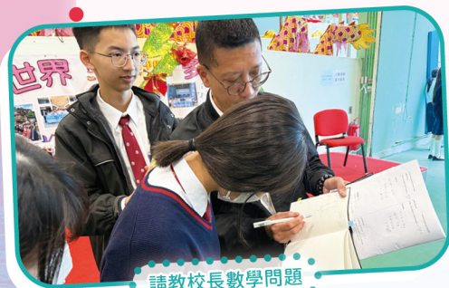
請教校長數學問題