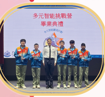
多元智能挑戰營 畢業典禮