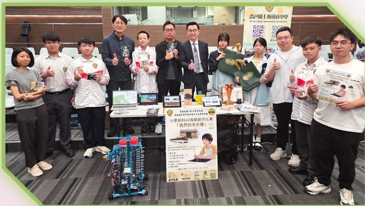
• 本校STEAM小組與校長合照

本校安排學生參加由元朗區中學校長會及元朗大會堂合辦的「元朗區中學 Maker Faire 暨中學巡禮」。活動中同學們展示了本校的STEAM學習成果，贏得各位來賓的好評。