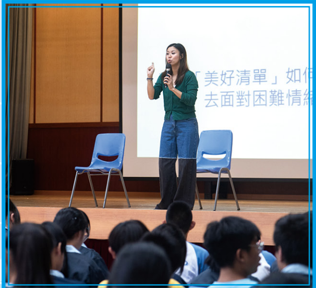
• 「每一件美好的事」到校演出