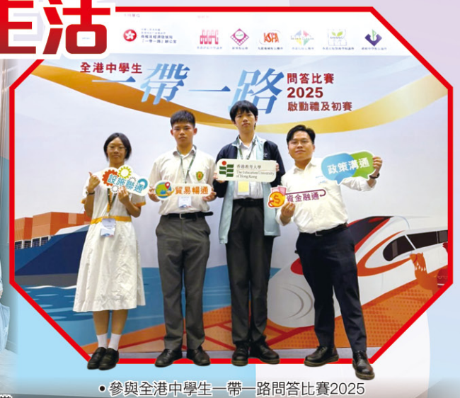
• 參與全港中學生一帶一路問答比賽2025