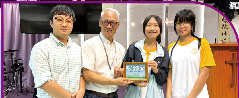
• 機構表揚本校義工以行傳愛