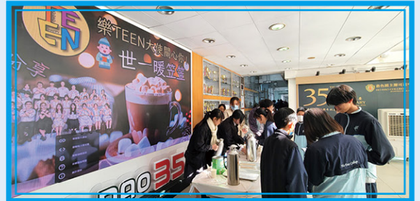
• 樂TEEN 大使為同學送上熱朱古力