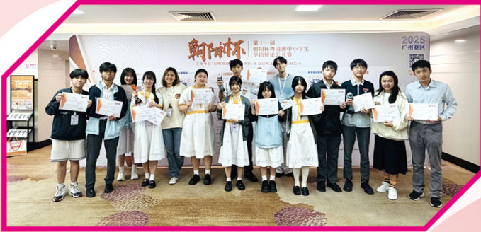
• 朝陽盃：參賽隊員及老師大合照