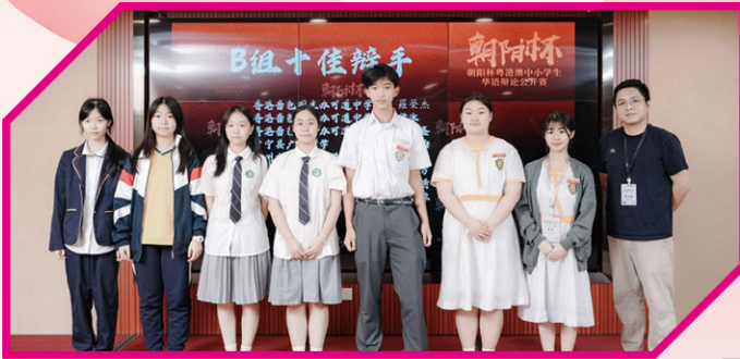
• 朝陽盃：各校最佳辯手