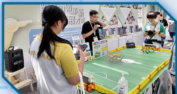
• 同學嘗試四人足球機械人比賽

在十月下旬，本校學生參加「創新科技嘉年華」，透過嘉年華的大型展覽活動，讓學生接觸最新的創科產品和技術，獲益良多。