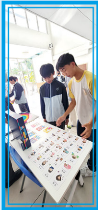
• 以遊戲認識不同的情緒