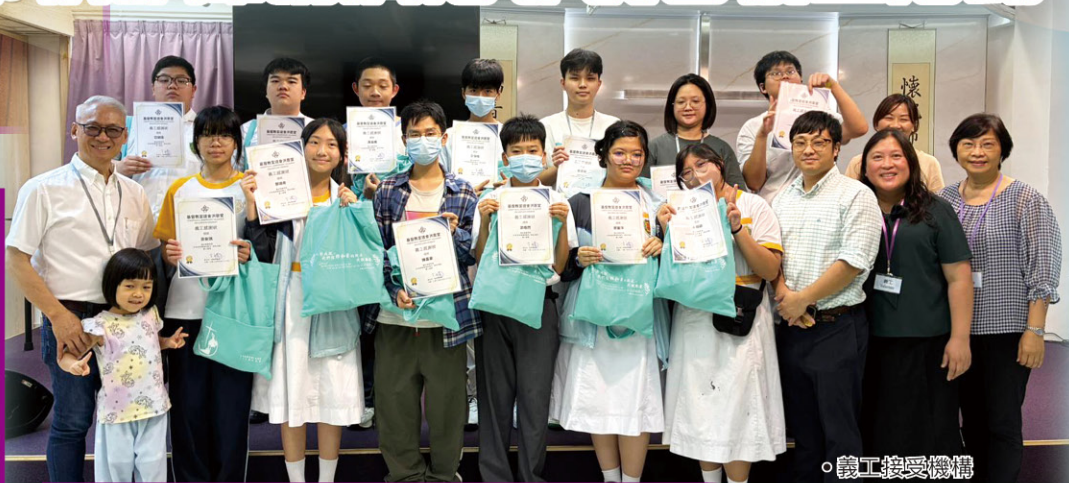
• 義工接受機構 頒發感謝狀