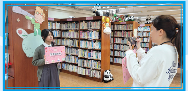
• 向大埔火災救援的隊伍拍攝致謝短片