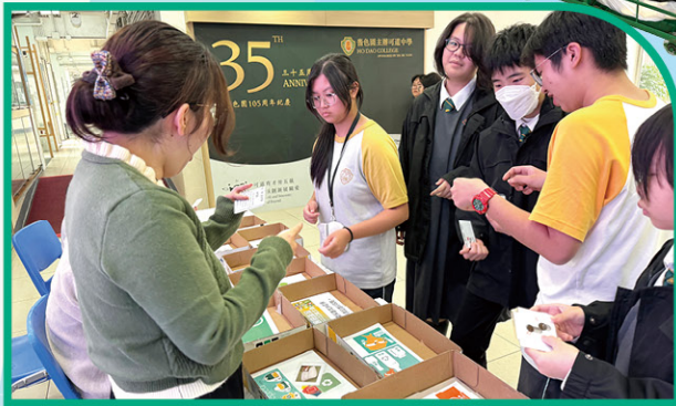
• 學生學習廢物分類回收