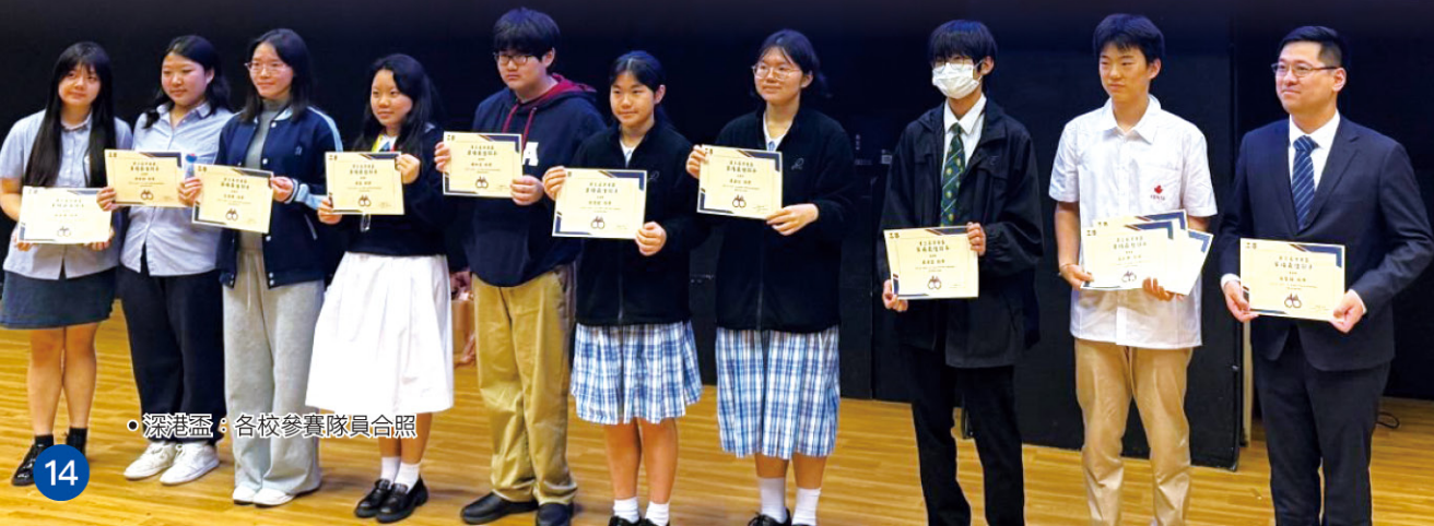
• 深港盃：各校參賽隊員合照