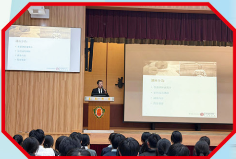
• 「法律制度及法治精神」講座