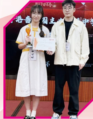
• 朝陽盃：最佳辯手獲獎學生