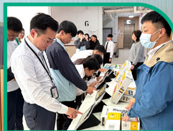
• 校長與學生一同響應環保周活動