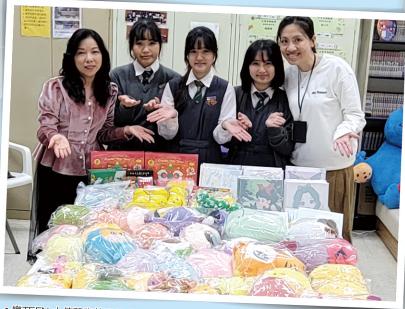
• 樂TEEN 大使募集的玩具成果

由本學年起，本校推行「生日·祝福·便服日」，此活動每月特設一天讓該月生日的同學自行穿便服，並貼上「生日貼紙」回校，讓全校師生亦可送上生日祝福。樂Teen大使到班房送上生日禮物更顯圓滿。同時，我們默默為同學製造不同驚喜，如送打氣雪糕。為同學在生活中加一點「甜」，樂Teen大使趁著入冬送上朱古力熱飲。當然，我們不會忘記各位勞苦功高的老師，樂Teen大使每逢節日都會準備窩心禮物以表心意。