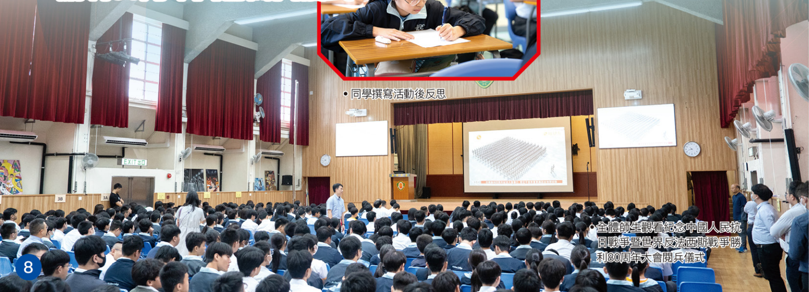
• 全體師生觀看紀念中國人民抗日戰爭暨世界反法西斯戰爭勝利80周年大會閱兵儀式