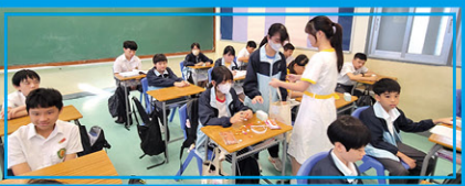
• 大使派發香氣護手霜