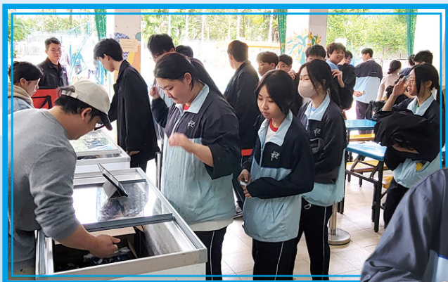
• 為生活加一點甜的打氣雪糕

本校安排同學在中秋節書寫心意卡予「銀杏館」，身體力行表達對社會的關愛。另外，全校師生對大埔火災事件身同感受，同學特意書寫心意卡予災民及參與救援的隊伍。另外，樂Teen大使領頭響應「香港浸信會聯會專業書院」舉行的 Toys for care · play for good 玩具募集及贈送行動，結果募集了近三百份全新玩具及文具，為受火災影響的孩子送上祝福。最後，樂Teen大使更拍攝致謝視頻，向救援隊伍送上最深切的敬意。