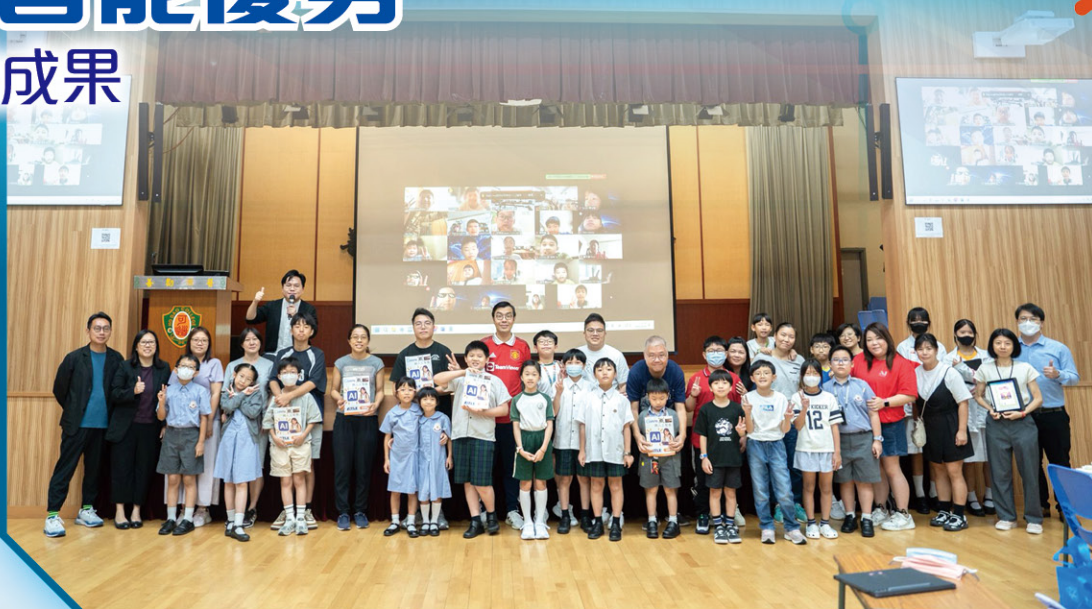
• 實體參賽者大合照

本校於10月4日舉辦了「小學創科AI海報創作比賽——『我們的洪水橋』」工作坊。當日有超過120位師生參與，包括線上與實體。工作坊內容豐富，包括洪水橋的歷史與發展、生成式AI中文寫作及Canva軟件AI教學。每位參加者帶著富有洪水橋特色的AI海報回家，正是本校推動科技教育的初心！