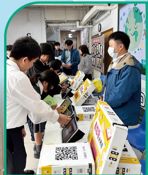
• 丟垃圾大考驗電子問答遊戲