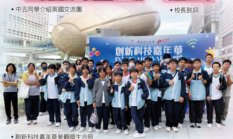
• 創新科技嘉年華參觀師生合照

本校學生於11月初的「2025 MakeX 機械人挑戰賽—總決賽(香港)」中表現出色，奪得多個獎項，成績令人鼓舞，成績如下：