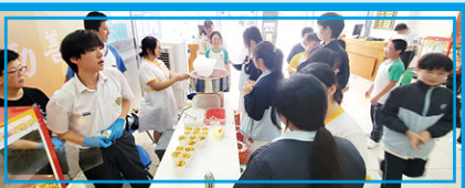
• 樂TEEN 大使送贈打氣小食