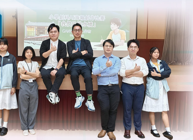
• 負責比賽的師生合照

本校安排學生參加由元朗區中學校長會及元朗大會堂合辦的「元朗區中學 Maker Faire 暨中學巡禮」。活動中同學們展示了本校的STEAM學習成果，贏得各位來賓的好評。