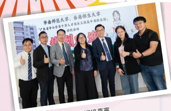
• 校長與本校創科團隊迎接嘉賓

在十月上旬，廣東省中小學各班主任團隊蒞臨本校，了解本校的創科人才培育策略。本校創科教育團隊分享了多項學生創科作品，包括了AR奧運體驗、虛擬文物遊、VR武術體驗、AI繪本創作及英國丹麥創科文流團等項目，獲訪問團高度讚賞。