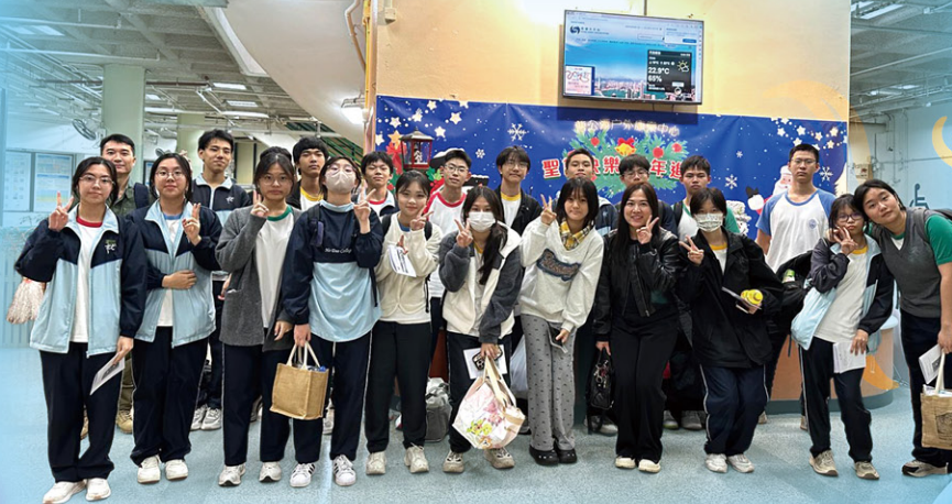
• 理科探究體驗營：師生大合照

為加強同學對科學知識領域的探索精神，本校舉辦各項理科活動，於理科周內，讓同學透過多項活動，體驗科學知識的領域，其中包括晨讀時間閱讀理科知識材料、攤位活動、紙飛機比賽、飲管橋比賽、觀星活動及理科探究體驗營。本校期望學生在參與活動期間，結合日常生活觀察所得，可有效提升對理科知識學習的興趣。