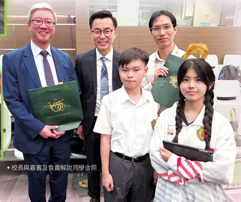
• 校長與嘉賓及負責解說同學合照