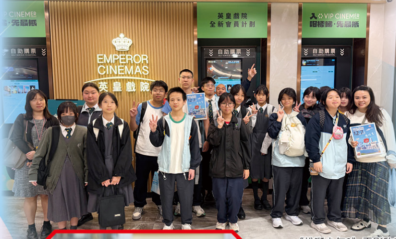
• 《雄獅少年2》電影欣賞