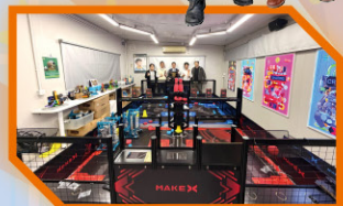
• Make Lab 內部