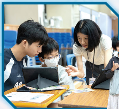
• 李老師引導參賽者完成作品