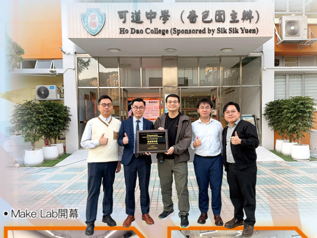
• Make Lab開幕