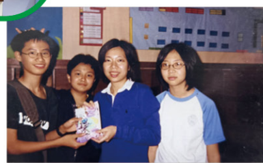
• 初中曾擔任圖書管理員（右一）