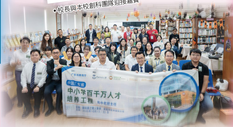
• 廣東省各班主任團隊合照留念

在十月上旬，廣東省中小學各班主任團隊蒞臨本校，了解本校的創科人才培育策略。本校創科教育團隊分享了多項學生創科作品，包括了AR奧運體驗、虛擬文物遊、VR武術體驗、AI繪本創作及英國丹麥創科文流團等項目，獲訪問團高度讚賞。