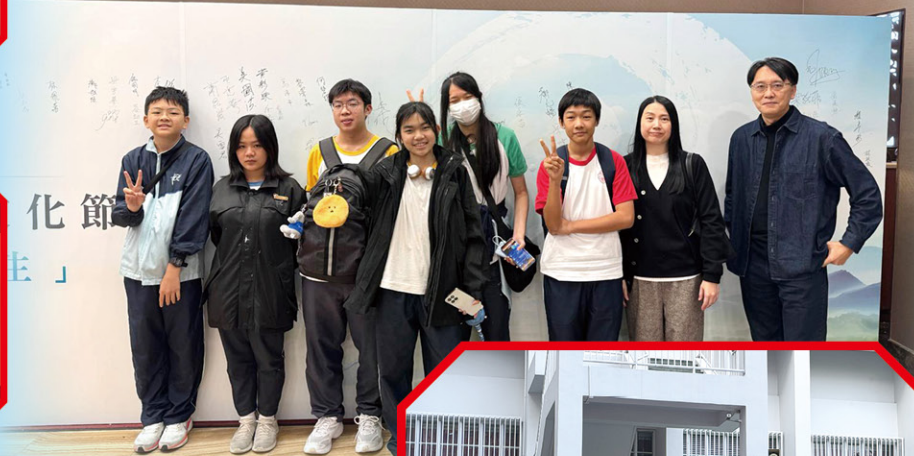
• 參與黃大仙仙俗文化節文化講座