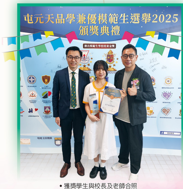
• 獲獎學生與校長及老師合照