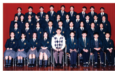
• 中三時的全班合照