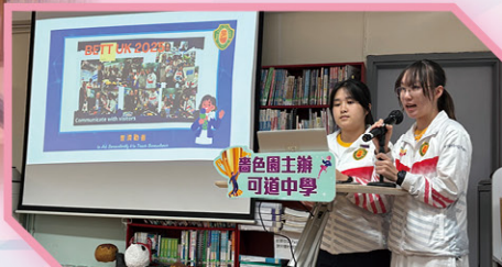
• 中五同學介紹英國交流團