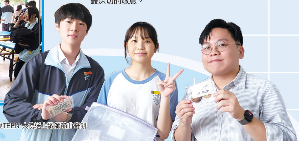
• 樂TEEN 大使送上敬師節曲奇餅