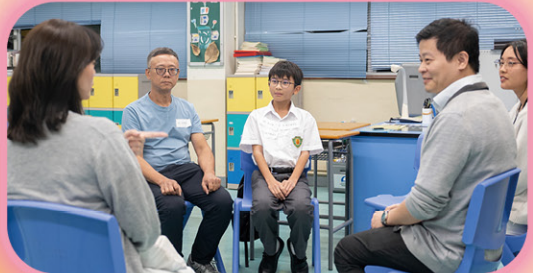
• 家長與班主任會談