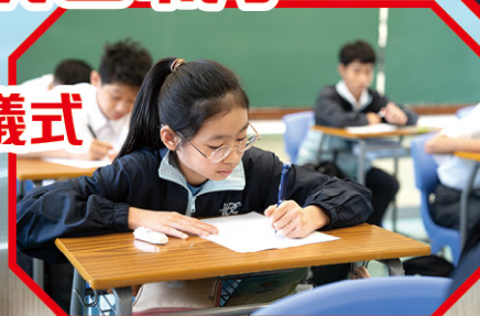
• 同學撰寫活動後反思