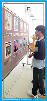
• 投下最喜歡的心靈打氣說話