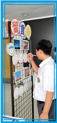
• 同學寫下鼓勵心聲