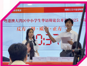
• 朝陽盃：本校隊員詞鋒銳利