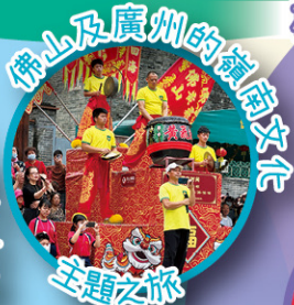
佛山及廣州的嶺南文化主題之旅