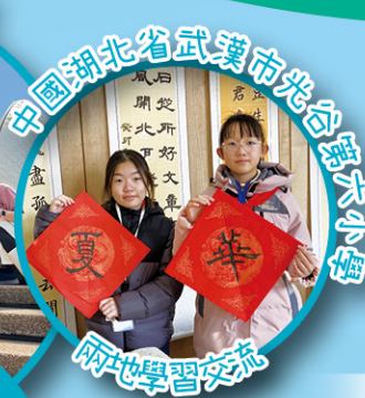
中國湖北省武漢市光谷學子之遊

八天遊學團，學生除學習英語，也認識了澳洲豐富多元的文化，親身體驗當地的風土人情，擴闊視野。