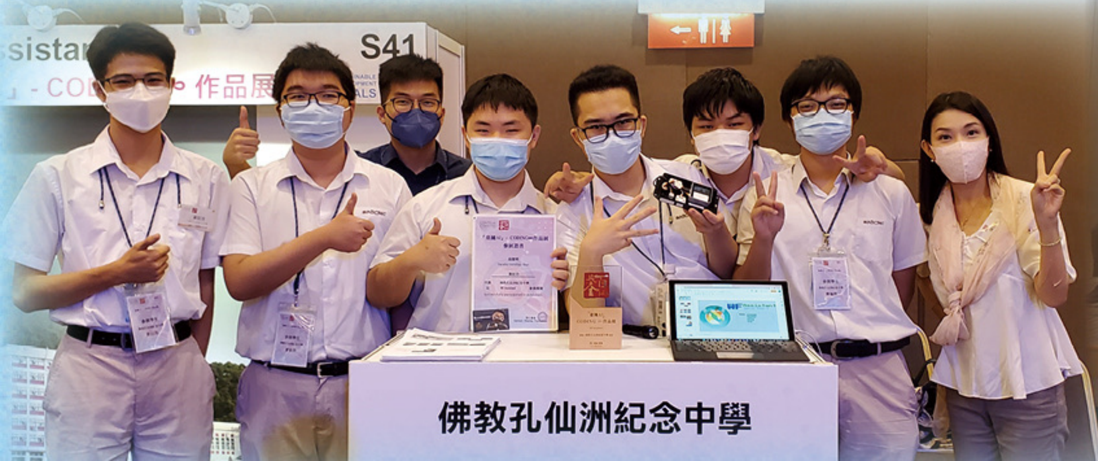
佛教孔仙洲紀念中學

在資優學生培訓方面，學校推薦學術表現卓越的學生參加不同大專院校的資優課程、學術比賽及傑出學生選舉，期望同學擴闊視野，掌握不同學習方法，讓學業成績更進一步。每年不少學生於數理、徵文、演說朗誦比賽獲獎，包括國際奧林匹克科學比賽、香港數理教育學會主辦科學評核測驗、魯迅青年文學獎、校際朗誦節等。本校着重學生均衡發展，多年來培養出數以千計的優秀學生，在不同的學生選舉中獲獎無數。例如 2023 年的「黃大仙區傑出學生選舉」，本校學生共奪得八個獎項。在「九龍地域傑出學生選舉」及「香港 200-領袖計劃」等，每年均有學生獲選。