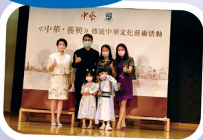
中華文化藝術日 弘揚中華文化