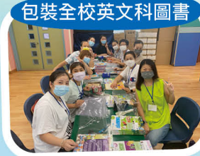
包裝全校英文科圖書