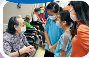
「送暖特工隊」 關懷身邊的人