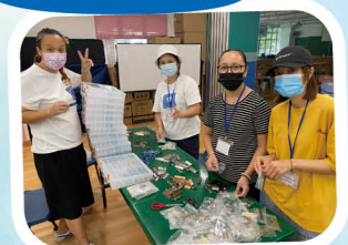
分配一人一職名牌