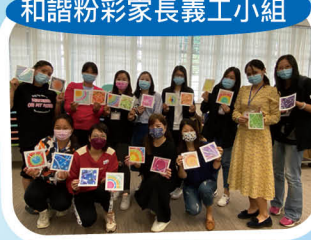
和諧粉彩家長義工小組