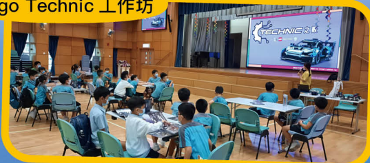
Lego Technic 工作坊

本校透過不同「STEM」活動，積極推動創新科技學習，鼓勵學生在科學、科技、藝術及數學領域探索，裝備學生應對社會的轉變和挑戰。