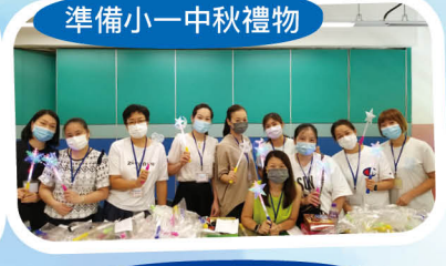
準備小一中秋禮物