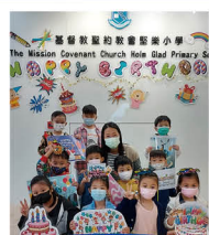
生日便服日 為同學送上祝福