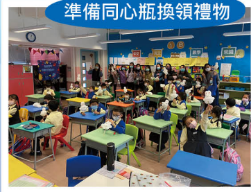
準備同心瓶換領禮物