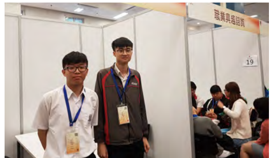
• 同學參與職業興趣諮詢活動。

為了讓高中同學了解各行各業的工作環境和實況，以規劃未來的職業路向，本校中四、五同學多年來均參加「學校起動」計劃及九龍倉旗下企業合辦的「職出前路我做到」生涯規劃日活動。活動中同學除可以得到個別的擇業諮詢，更能根據個人興趣即場參加不同行業的工作體驗，例如寵物美容、3D電腦動畫繪製、精美糕點製作、專業舞蹈排練，甚至是練馬師、健身教練、調酒師、魔術師等等，令同學更清楚掌握不同工作的性質及工作環境，為未來作好準備。