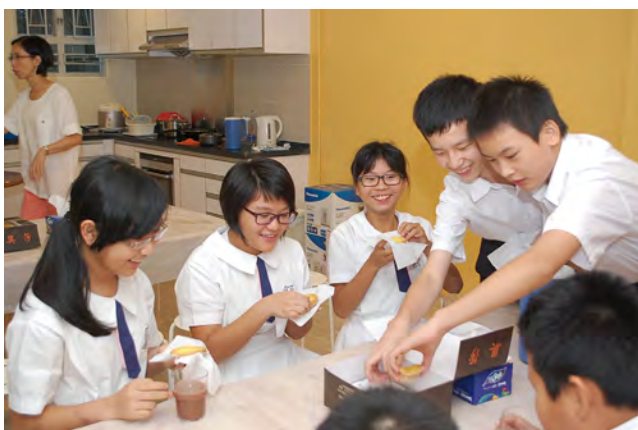
• 同學們在功課輔導小休時，享用美味的茶點。