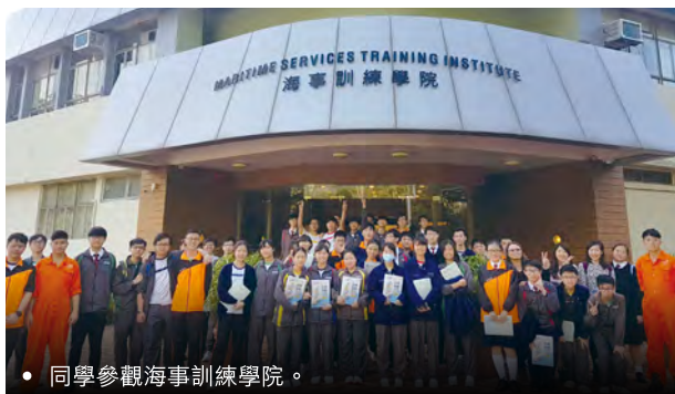
• 同學參觀海事訓練學院。