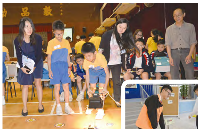
• 「小學太陽能模型車 mini 奧運會」。