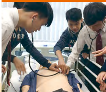
• 同學透過實踐認識長者護理工作。