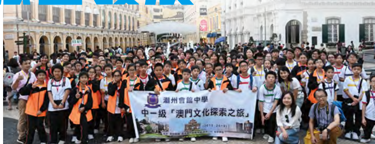
• 參觀澳門四大廣場之一：議事亭前地。

為配合新高中課程的要求，培養同學多元經歷，以期在未來學習的基礎上，收到「見多識廣，觸類旁通」的果效，去年11月21日至22日，全級中一進行《澳門文化探索之旅》。