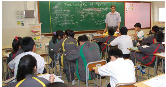
• 初中同學參加課後英文拔尖班。

「學校起動」計劃投放大量資源以提升成員學校的教學效能。本校利用上述資源，為高中同學們舉辦中、英、數等學科的課後拔尖班及補習班，以提升他們的應試技巧，讓他們在香港中學文憑試取得更好的成績。此外，亦為初中同學們舉辦不同科目的補習班和輔導班，以鞏固他們在各學科的基礎。