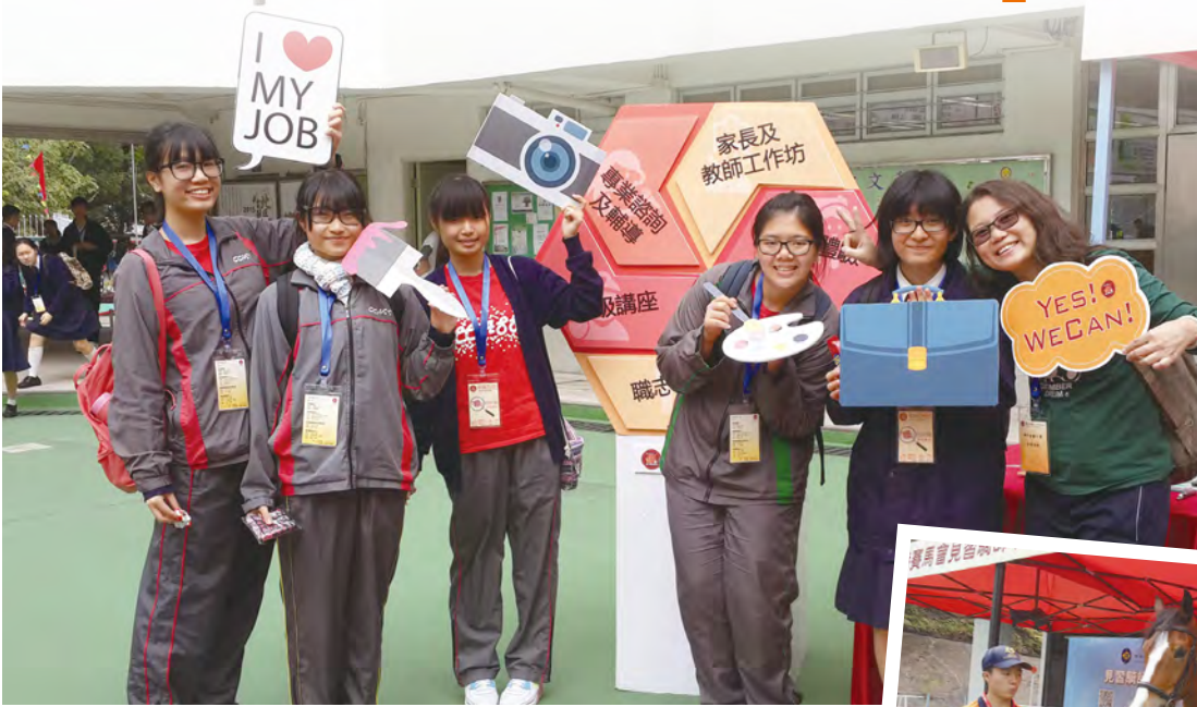
• 同學透過不同的體驗活動，盡早規劃人生。