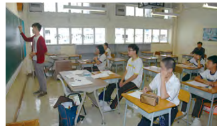
• 同學們參加數學科補習班，鞏固數學基礎。