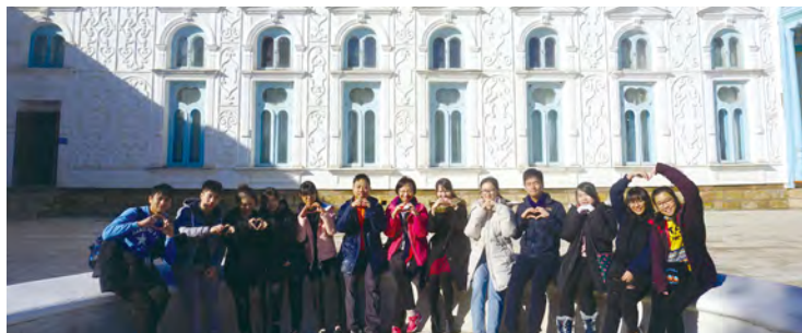
• 參觀烏茲別克文化古蹟，眼界大開。

我校參加了「一帶一路」國際合作香港中心的香港青年新跑道計劃，全額資助到「一帶一路」沿線國家進行探索，目的是讓學生從生涯規劃視角了解自己在當地事業發展的機遇。校長及2名教師和10位高中學生於去年11月19日至27日進行了為期9天的烏茲別克探索之旅，分別到訪了塔什干、撒馬爾罕及布哈拉，參觀鵬盛國家級工業園區、塔什干國立大學、塔什干國立師範大學附屬中學及孔子學院，並與當地的中國貿易協會主席及中國駐烏茲別克大使館的領事對談，是次考察讓學生獲益良多。