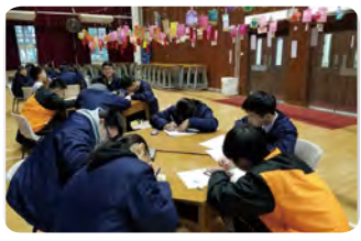
• 中文科以花燈活動配合創意寫作。

活動讓學生應用數學的正多面體知識、科學的基本電路知識、視藝科的美術設計，並結合設計與科技科物料知識及製作技巧，製作環保花燈，最後配合中文科的猜燈謎及寫作活動，過程不但能讓學生綜合應用不同學科知識，亦兼具創新、創意、協作解難等元素。