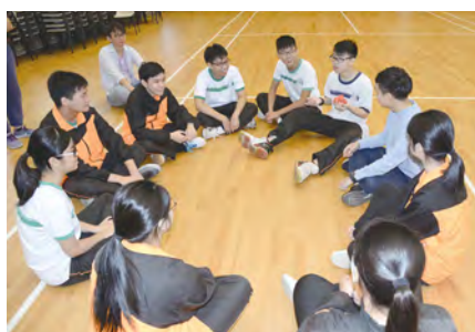
• 活動完結後，導師與同學作分享和總結，在學習中成長。