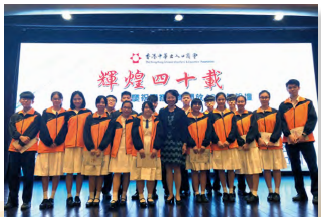
• 梁校長與學生們出席商界論壇。

梁校長表示，多謝商界和辦學團體的支持，學校一如既往地不斷提供活動和機會給同學，讓學生明白世界雖然很大，亦有給予年輕人發展的機會，同學們只要找到自己的專長和能力，認清目標，努力裝備自己，就可以朝着自己的目標進發，期望學生踏入潮州會館中學後，通過學校的培養和教導，無懼面對瞬息萬變的社會，仍能找到自己頭上的一片天發光發熱，發揮所長！