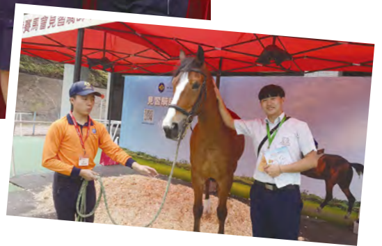
• 同學親身接觸馬匹，了解騎師的日常工作。