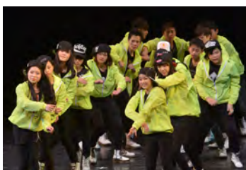
• 流行舞蹈隊憑舞蹈「Chilli」勇奪中學爵士群舞組甲級獎。