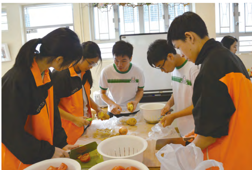
• 同學分工合作，親手製作一頓豐富的午餐。