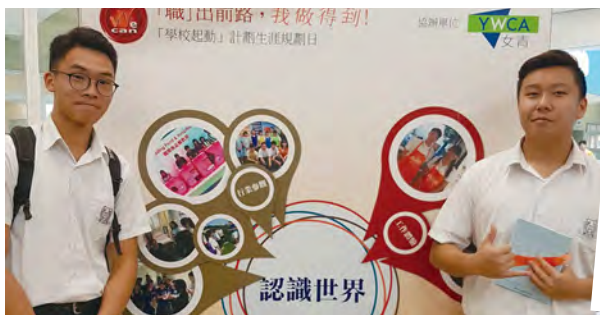
• 同學於生涯規劃日中有機會跳出校園，了解世界各行各業的發展。