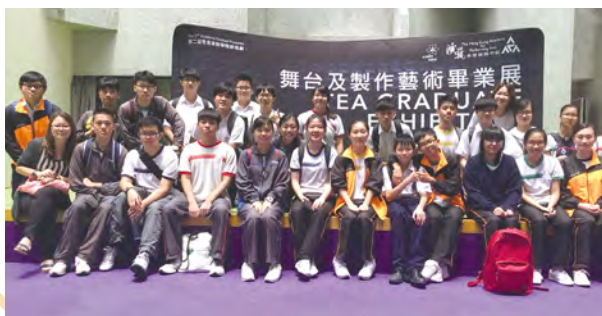
• 中六同學參觀香港演藝學院。