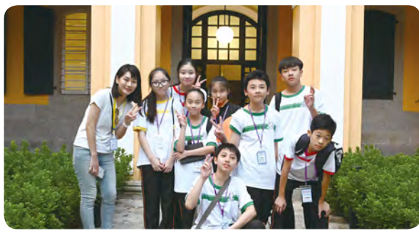
• 參觀何東圖書館，讓同學們感受澳門文化氣息。