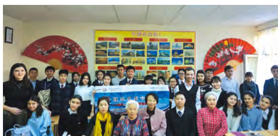
• 同學們與當地學習漢語的中學生交流。