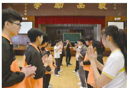
• 同學跟從日營導師的指揮，互相合作，進行集體遊戲活動。