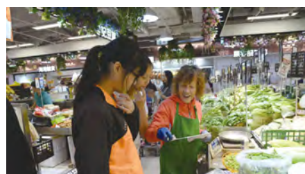
• 同學在日營中分成不同小組，親身前往市場購買筵菜，體驗真實的煮食生活。