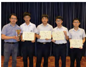
• 本校同學於聯校探訪活動中的「魚菜共生」問答比賽中勇奪冠軍。