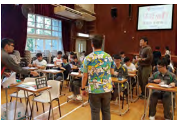
• 同學「投身」不同的行業，體驗工作世界。