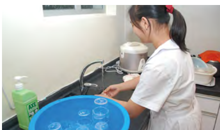
• 同學們需要在用餐後清理自己的杯子，藉此培養自理能力。

學校為進一步扶助弱勢社群，學校成功申請由社會福利署推出的「攜手扶弱基金——課餘學習及支援項目專款」，為基層家庭的學生推行更多課餘學習及支援項目，並利用款項聘請兩名教學助理，在課餘的功課輔導班為有需要的初中同學提供託管服務和功課輔導，以及課餘的關愛學習活動。