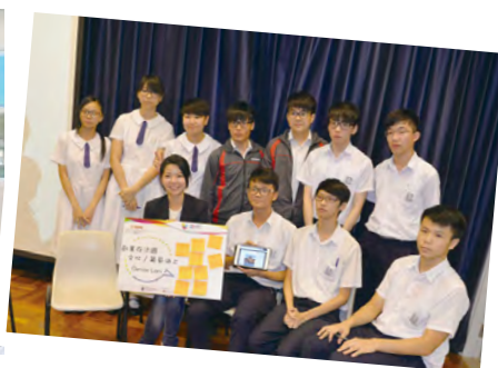
• 不同特色行業的工作者（如法國葡萄酒文化產業負責人）到校與同學分享職業心得。