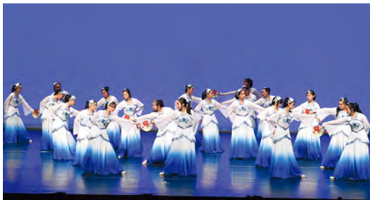
• 中國舞蹈隊以群舞「青花」參加第五十五屆學校舞蹈節，奪得乙級獎殊榮。