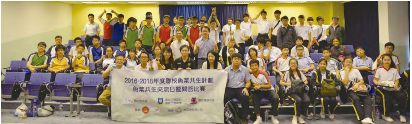
• 參與「魚菜共生系統聯校探訪活動」的師生於本校演講廳合照留念。