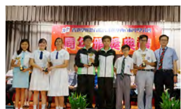
• 女子乙組排球隊奪得 2017-18 年度校際女子乙組排球比賽季軍。