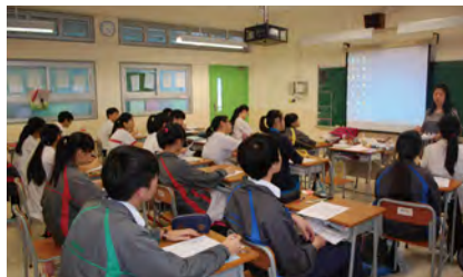
• 高中同學們參加中文科課後拔尖班，希望在香港中學文憑試取得更佳成績。

此外，學校更為有特殊教育需要同學提供語言及溝通訓練、社交訓練、讀寫訓練、親子園藝班、氣球藝術班及自理能力訓練等，同時亦為該類同學提供生涯規劃輔導，幫助同學更了解升學及就業出路。