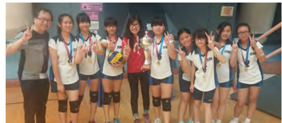
• 女子丙組排球隊勇奪沙田及西貢區 2016-17 年度校際女子丙組排球冠軍。