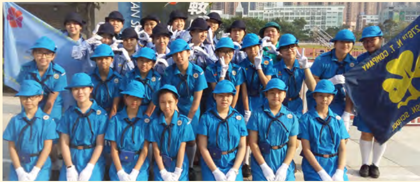
• 本校女童軍連續十年獲頒香港女童軍優秀隊伍獎；而深資女童軍亦兩度獲頒香港女童軍優秀隊伍獎。