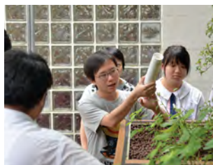
• 導師向本校高中同學講解「魚菜共生」概念。