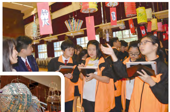
動腦筋，看誰先猜中燈謎。