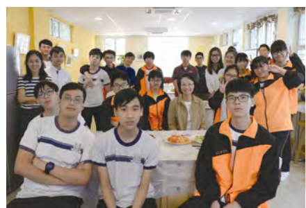
• 梁校長見證同學努力的成果，與同學一起享用豐富的午餐。