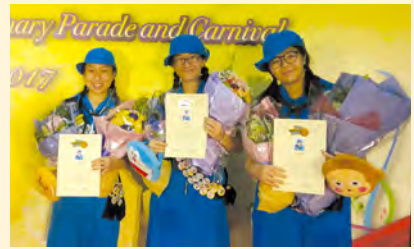
• 香港總監榮譽女童軍獎章。