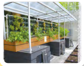
• 本校「魚菜共生」系統。