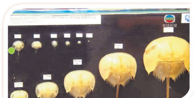
西貢崇真天主教學校(中學部)的科學中心以模型形式展出馬蹄蟹的成長變化