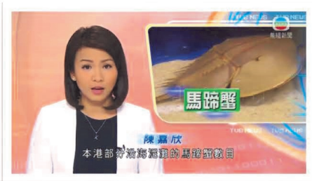
無綫新聞近日就馬蹄蟹人工保育繁殖的議題訪問本校

本港馬蹄蟹數大幅減少，有學校以人工繁殖保育。本港部分沿海泥灘的馬蹄蟹數目近年大幅減少，有學校嘗試人工繁殖，加強保育馬蹄蟹。