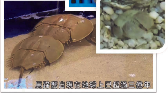
馬蹄蟹出現在地球上已超過三億年

這個小生命在蛋內活動，最後破蛋而出。牠們是俗稱「馬蹄蟹」的蟹，是蜘蛛和蠍子的近親，與蟹並無關係。馬蹄蟹出現在地球上已超過三億年，