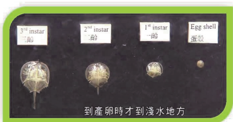
到產卵時才到淺水地方