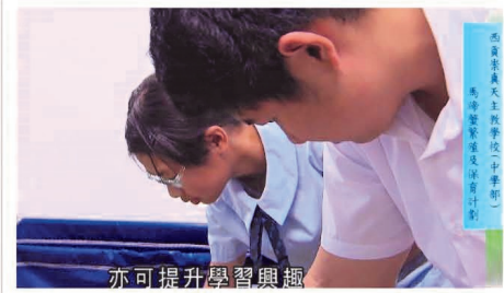
西貢崇真天主教學校(中學部)推行了「馬蹄蟹繁殖及保育計劃」，參與學生每天餵食，清潔馬蹄蟹，見證牠們由繁殖至孵化的過程