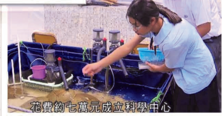
花費約七萬元成立科學中心

西貢這間中學花費約七萬元成立科學中心，在這個三米乘兩米的水池，養殖了七對馬蹄蟹，主力由學生照顧。